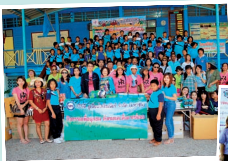
ร่วมบริจาคอุปกรณ์การเรียน อุปกรณ์กีฬา ให้กับโรงเรียน 3 แห่ง ในจังหวัดจันทบุรี