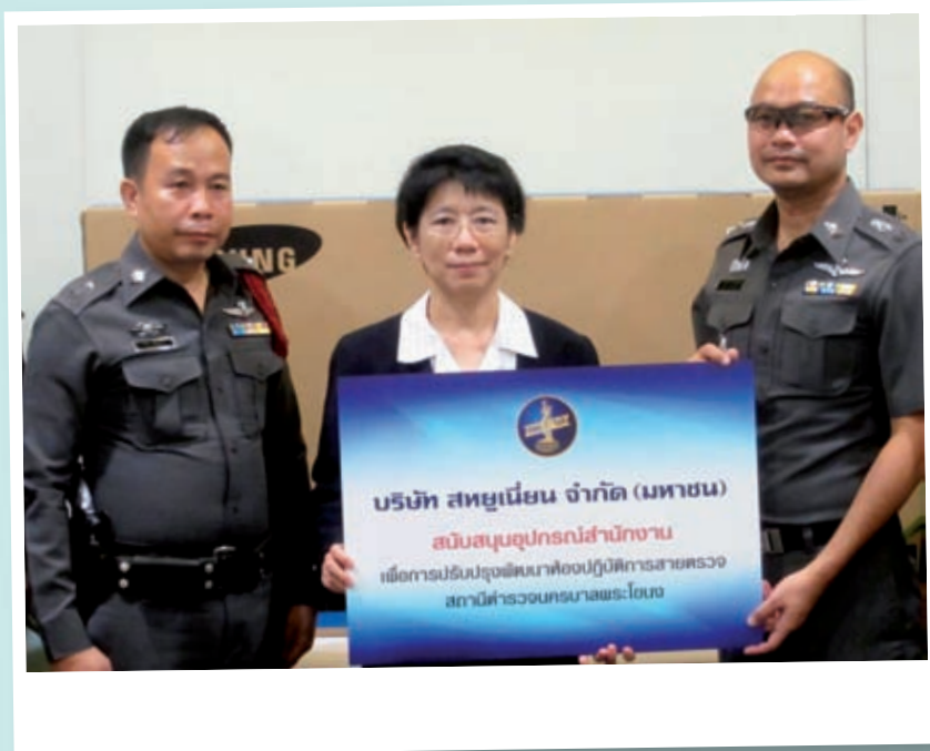
สนับสนุนอุปกรณ์สำนักงาน แก่สถานีตำรวจนครบาลพระโขนง