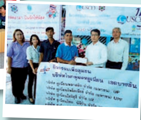
ร่วมบริจาคเงินเพื่อปรับปรุง ซ่อมแซม และขยายอาคารเรียนชุมชนบางชันพัฒนา