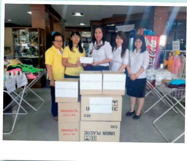
ร่วมบริจาคผลิตภัณฑ์ของบริษัทในกลุ่ม เพื่อหารายได้สนับสนุนการจัดงานวันคนพิการ