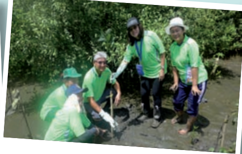
ร่วมโครงการปลูกป่าชายเลนกับชุมชนตำรุ ตำบลบางปูใหม่ อำเภอเมือง จังหวัดสมุทรปราการ