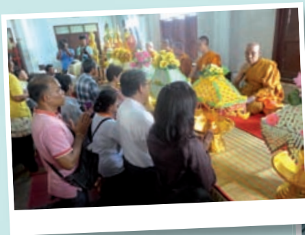
ร่วมทอดกฐิน ณ วัดตำหู จังหวัดสมุทรปราการ