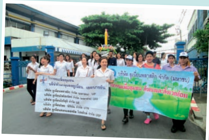
ร่วมทำบุญแห่เทียนเข้าพรรษา ณ วัดบำเพ็ญเหนือ กรุงเทพมหานคร